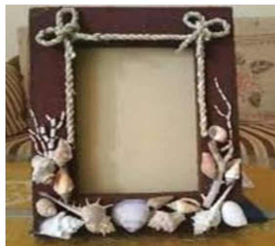
(Figura Cangkang Kerang)