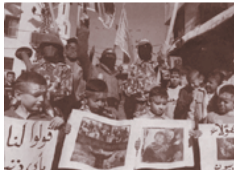
Reaksi masyarakat Palestina terhadap penyerangan Israel kompas