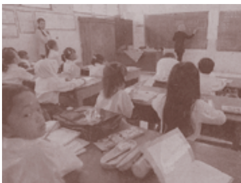
Kompas Sekolah juga memiliki andil besar dalam proses sosialisasi anak

Media massa merupakan salah satu unsur teknologi yang memiliki peranan sebagai media sosialisasi. Melalui media akan terjadi transformasi sosial dan budaya terhadap masyarakat luas. Alat komunikasi ini memiliki fungsi untuk menyampaikan pesan tanpa terikat oleh nilai dan norma yang ada di masyarakat.