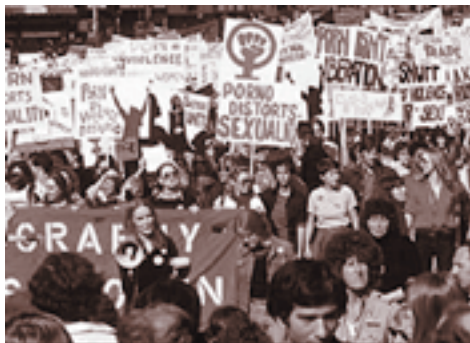
Reaksi Masyarakat yang menolak Pornografi kompas

Suatu ilmu sekurang-kurangnya dapat dirumuskan dalam dua cara, yaitu: