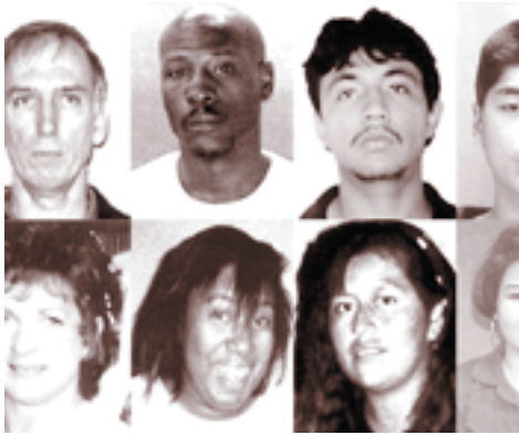
www.id.wikipedia.org Jenis Ras Manusia

membantu menjelaskan beberapa persamaan dalam kepribadian dan perilaku semua orang. Setiap warisan biologis seseorang juga bersifat unik, yang berarti bahwa tidak seorang pun yang mempunyai karakter fisik yang sama. Sebagian masyarakat menilai bahwa kepribadian seseorang tidak lebih dari penampilan warisan biologisnya. Karakteristik kepribadian seperti ketekunan, ambisi, kejujuran, kriminalitas dan kelainan seksual dianggap timbul dari kecenderungan-kecenderungan turunan. Contoh lainnya dapat dilihat dari IQ yang dimiliki oleh seorang anak akan mirip dengan IQ yang dimiliki oleh orang tua kandungnya. Faktor keturunan berpengaruh kuat terhadap keramahan perilaku kompulsif