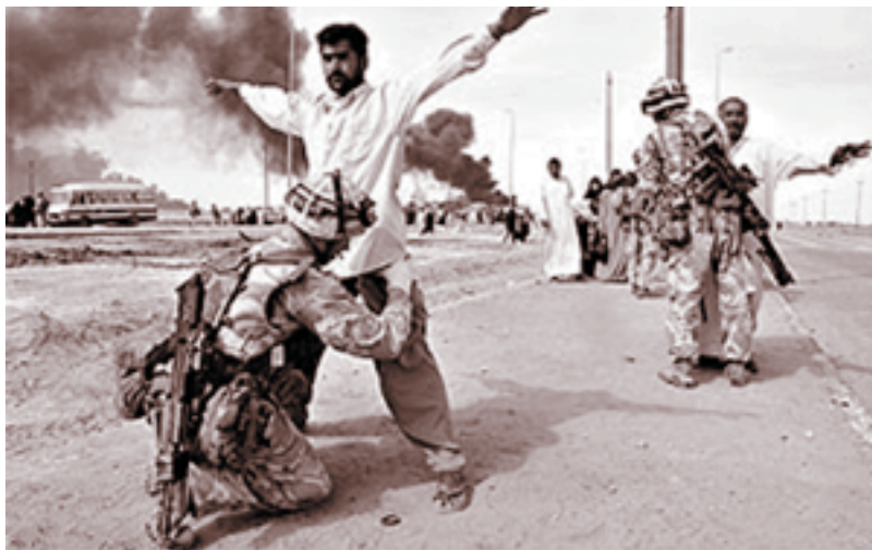
kompas Perang antara Irak dengan Amerika belakangan ini telah menghancurkan sistem tata masyarakat di Irak.

Hancurnya nilai sosial juga akan mengakibatkan hancurnya sistem sosial di masyarakat. Akibat terjadi penyimpangan-penyimpangan sosial dan masalah-masalah sosial. Contohnya, proses adaptasi nilai westernisasi yang tidak sesuai dengan nilai yang sebelumnya dianut oleh masyarakat Indonesia seperti pergaulan bebas yang banyak menimbulkan perilaku-perilaku yang tidak sesuai dengan nilai sosial masyarakat Indonesia.