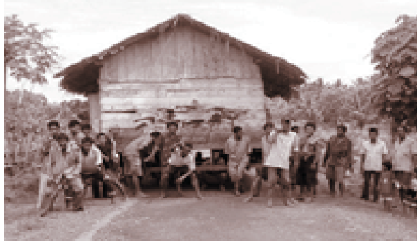
gotong royong merupakan ciri khas dari kebudayaan kompas bangsa indonesia

Nilai sosial merupakan gambaran dan ciri masyarakat tersebut, karena nilai itu adalah data yang diambil dari pengalaman masyarakat sepanjang sejarah masyarakat tersebut. Sebagai contoh nilai gotong royong dan nilai musyawarah yang dimiliki oleh masyarakat Indonesia. Nilai gotong royong dan nilai musyawarah itu menjadi identitas bangsa Indonesia.