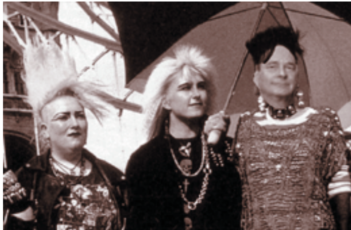
Anak-anak funk, merupakan salah satu gaya remaja masa kini

Dengan demikian tindakan dapat dikatakan sebagai gaya seperti kelompok atau person idealnya, yang ditiru bisa sebagian tindakannya bisa juga berusaha meniru seluruhnya, seperti cara berpakaian, cara berbicara, cara berindak bahkan gaya berjalan atau bertingkah laku. Imitasi memiliki segi negatif bagi pelakunya, yaitu daya kreasinya dapat tidak berkembang karena hanya ingin meniru orang lain. Segi positifnya ialah apabila yang ditiru adalah sikap dan perilaku yang sesuai dengan norma.