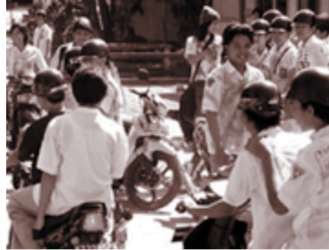
www.kutakartane- Aksi corat-coret yang dilakukan para siswa merupakan suatu bentuk penyimpangan

Contohnya adalah pemakai dan pengedar narkoba, penjudi, pemabuk dan penjahat.