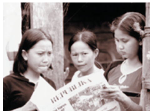
dok penulis Dengan media massa akan terjadi transformasi sosial budaya terhadap masyarakat