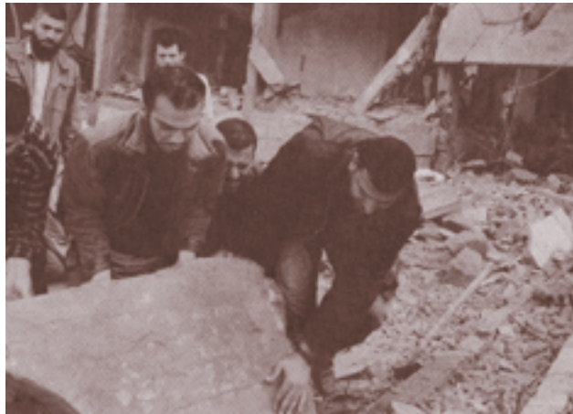
Kehancuran dan korban akibat peperangan menggambarkan betapa nyawa tidak ada harganya

Berbagai pelanggaran HAM dewasa ini nampak dekat di depan mata. Pembunuhan yang terjadi dalam setiap konflik sosial/ budaya seperti tawuran, perkelahian antar kampung/suku, ataupun pembunuhan yang terjadi dalam konflik politik/militer yaitu peperangan. Nyawa manusia seakan-akan tidak ada harganya. Pembunuhan hanyalah merupakan satu contoh di antara sekian perilaku penyimpangan.