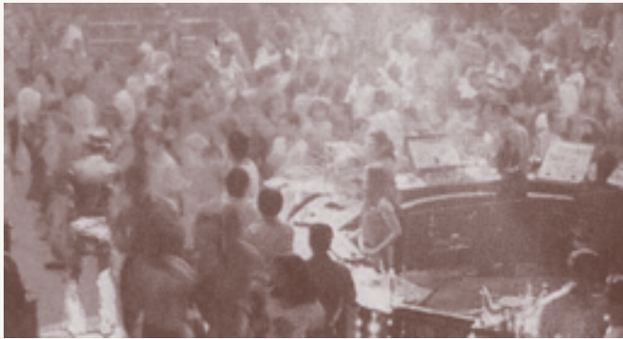
Media Indonesia Aktivitas para remaja di diskotik