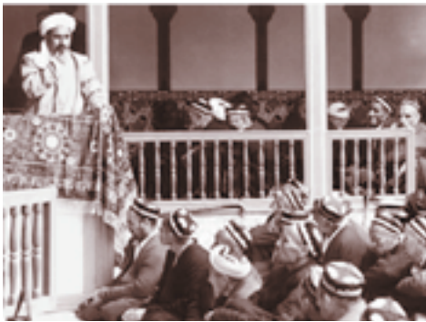
Seorang Kiayi merupakan sosok yang mampu memberi motivasi pada publik

kian rupa, sehingga orang yang diberi motivasi tersebut menuruti atau melaksanakan apa yang dimotivasi secara kritis, rasional dan penuh tanggung jawab.